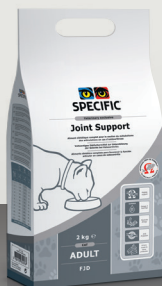
ZA MAČKE FJD Joint Support 2 kg