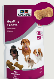
CT-H Healthy Treats 300 g