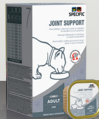
ZA MAČKE FJW Joint Support 7 x 100 g