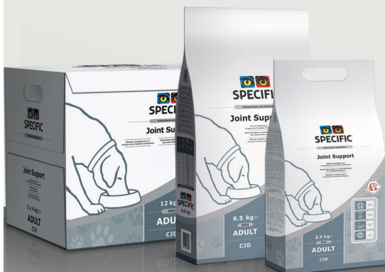
ZA PSE CJD Joint Support 12 kg, 6.5 kg, 2.5 kg

ZA MAČKE: Na voljo tudi kot odlična konzerva. SPECIFIC FJW Joint Support, v priročnem 100g pakiranju