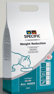
ZA MAČKE FRD Weight Reduction 7.5 kg, 2 kg, 0.9 kg

B: SPECIFIC™ FXW Adult z visoko vsebnostjo proteinov in malo ogljikovimi hidrati za uravnavanje sladkorja v krvi.