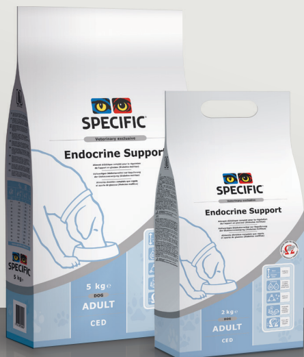
ZA PSE CED Endocrine Support 5 kg, 2 kg

Če je vaš pes diabetik in obenem potrebuje tudi uravnavanje telesne teže, priporočamo, da se najprej uredi telesna teža in nivo sladkorja v krvi s SPECIFIC™ Weight Reduction ali SPECIFIC™ Weight Control dieto (tudi opisani v tej knjižici). Ko žival doseže idealno telesno težo, pričnite s hranjenjem s SPECIFIC CED Endocrine Support za dolgotrajno vzdrževanje stanja (še posebno, če se pri psu pojavljajo komplikacije).