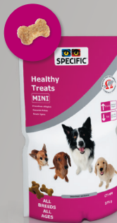
CT-HM Healthy Treats Mini 275 g