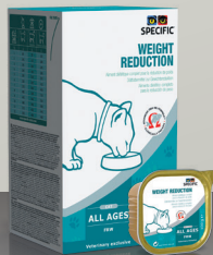
ZA MAČKE FRW Weight Reduction 7x100 g