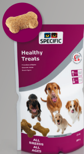
CT-H Healthy Treats 300 g