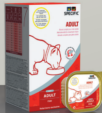
ZA MAČKE FXW Adult 7x100 g